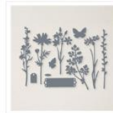
Stanzformen Wiese - 155852