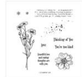
Stempelset Ablösbar Quiet Meadow (Englisch) - 155082