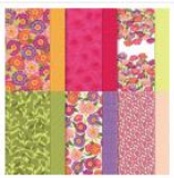
Designerpapier 12" X 12" (30,5 X 30,5 Cm) Zinnien- Zauber - 163469