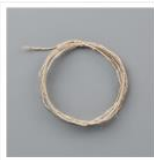
Leinenfaden - 104199