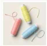
Kordel Im Kombipack Mit Drei Farben - 162759