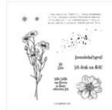
Stempelset Ablösbar Wiesenuhr (Deutsch) - 155851